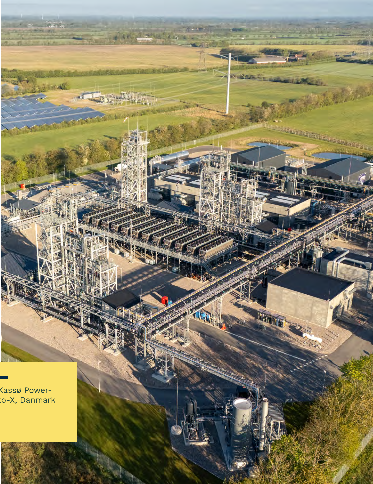
Kassø Power- to-X, Danmark